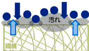
繊維から浮いてきた汚れを、洗浄成分が強力洗浄