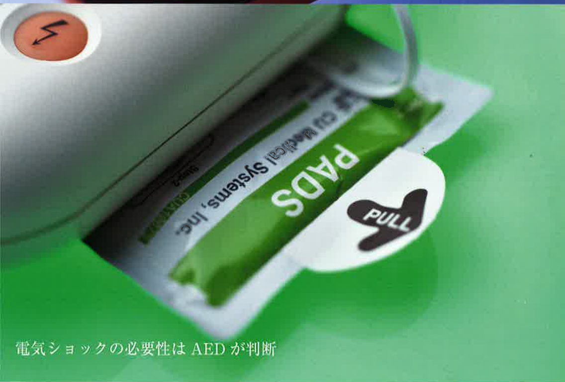
電気ショックの必要性は AED が判断