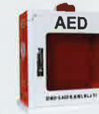
卓上型収納ケース ER1-SK-DM5