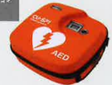
キャリングケース SP1-0A01