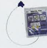
小児用電極パッド 小児専用 SP1-0A05