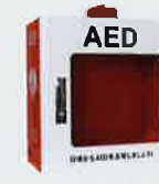
壁掛け収納ケース ER1-SK-DM4