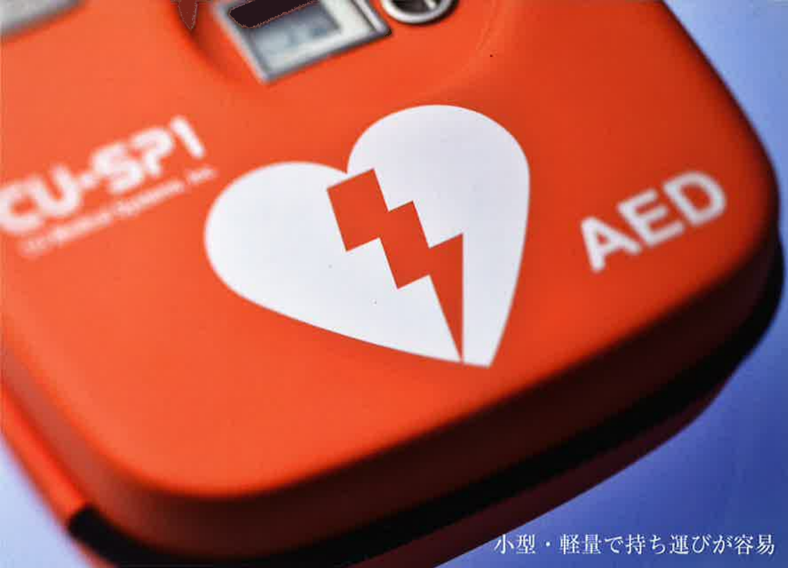
小型・軽量で持ち運びが容易